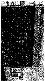
LA RIAPERTURA Il Roxy al Parioli riaprirà a settembre prossimo