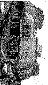
ARRIVA IL 3D Il Jolly passa a Valsania e si dota di impianto 3D

dell'Atlantic, già mercoledì sera nelle sale Mediaport sono saltati gli ultimi due spettacoli e momenti di tensione si sono registrati all'Adriano, il cinema leader del circuito, dove il pubblico è stato fatto entrare per lo spettacolo delle 22.30, ma in sette delle dieci sale del cityplex la proiezione non si è svolta, costringendo gli spettatori, dopo una lunga attesa, ad abbandonare la sala ed esigere fra molte proteste una pericolosa restituzione del biglietto.