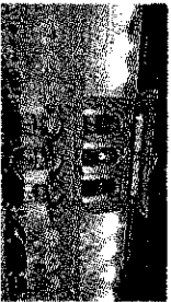
LA PROTESTA L'Adriano in sciopero insieme ad altre 10 sale

In seguito alla proclamazione dello sciopero, con l'eccezione