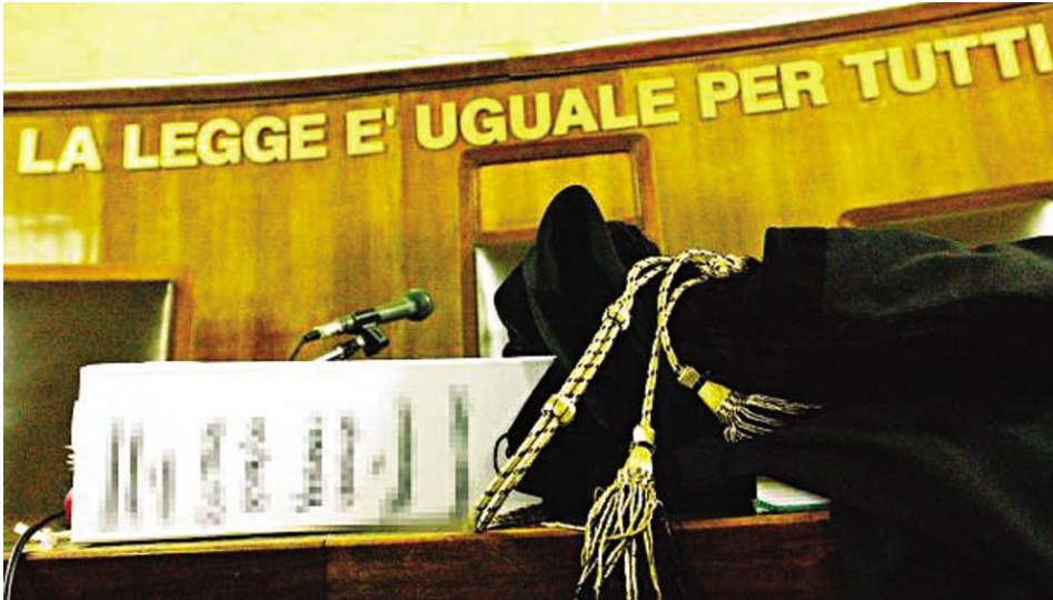
Un addetto alla vigilanza alle dipendenze di una cooperativa ha chiesto l'intervento del giudice contro la paga troppo bassa

Il paradosso: la retribuzione è prevista da un contratto sottoscritto anche dai maggiori sindacati